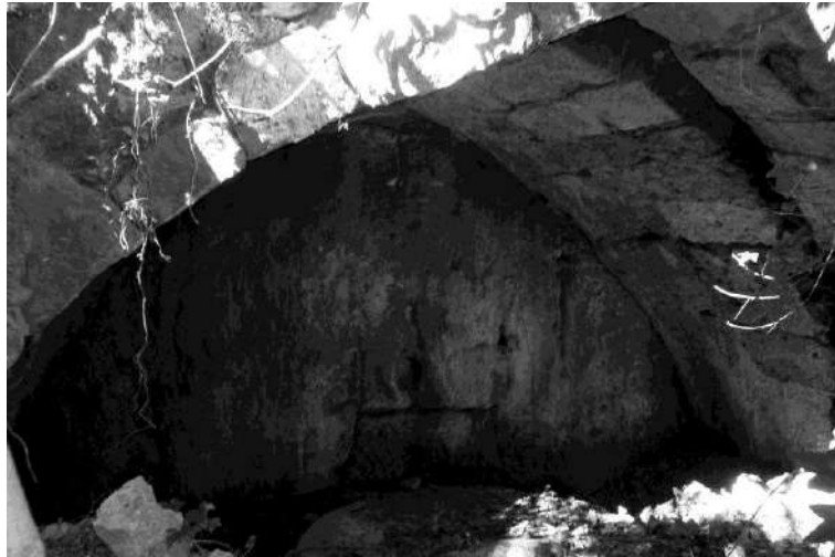
Ruïnes del moli fariner.

Si bé el pare Carles inicià el compromís de compra l'1 d'abril de 1906, l'escriptura definitiva duu la data de 22 d'agost, ja que en Pau Casals aprofità la seva vinguda a l'estiu a Sant Salvador per fer efectiva la compra. El que sobta, però, és que en l'adreça del habitatge figura el carrer Major, 28, però llavors l'enumeració de les cases de la placeta seguia l'ordre de les del carrer principal. Posteriorment, foren incorporades al carrer del Mig.