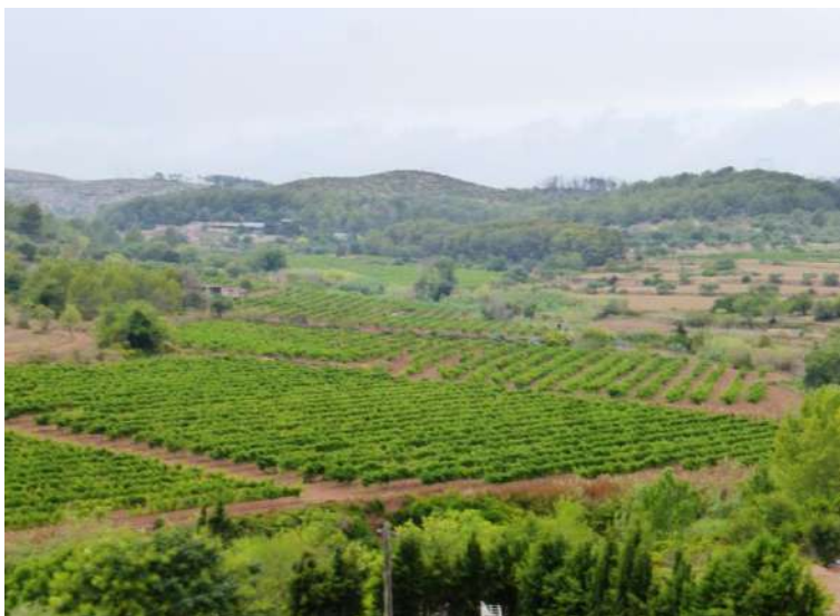
Vista panoràmica des d'un finestral de la casa del carrer del Mig, 1.

Heus ací la descripció de la casa que en fa l'autora: