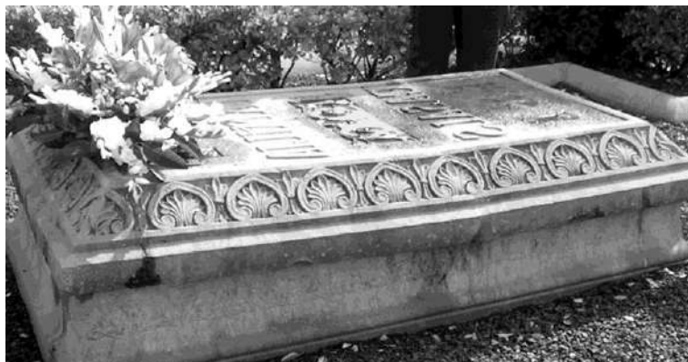
Mausoleu familiar al cementiri del Vendrell.