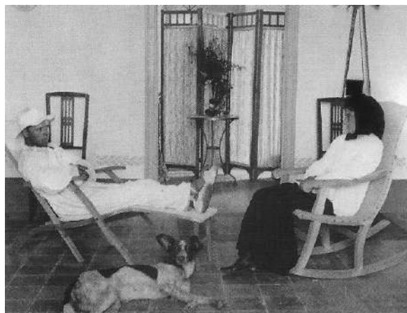
Pau Casals i la seva mare a la Casa de Sant Salvador.

Aquesta dedicació de la mare a promocionar la carrera artística del seu fill Pau, acompanyant-lo a Madrid, a Brussel·les, a París, etc., condicionà molt la vida dels pares, ja que afectava la vida familiar. D'això n'era ben conscient en Pau: «Jo, es deia amb tristesa, sóc sovint motiu de discussió entre ells: potser ara viuran més units» (p. 158).