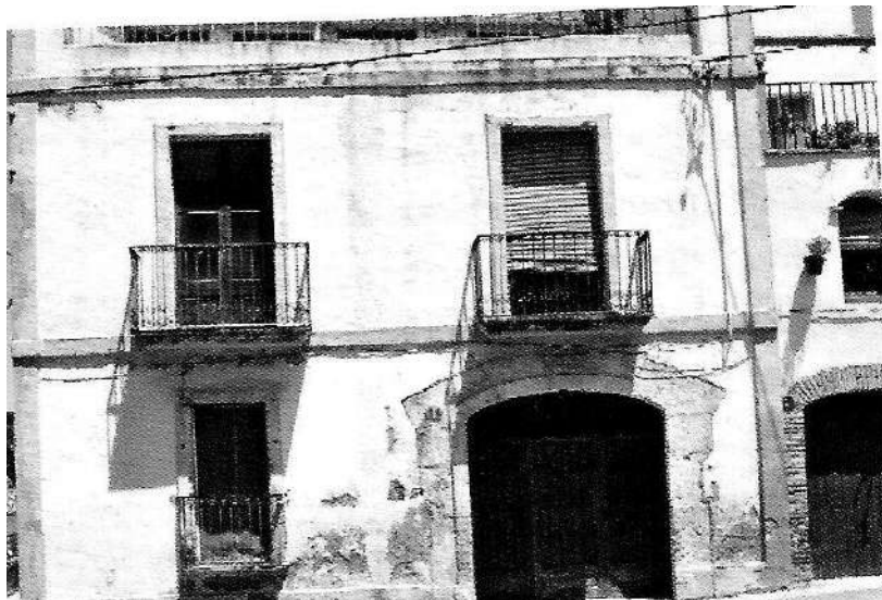
Casa del Moliner del carrer del Mig, núm. 1

Si bé el pare Carles inicià el compromís de compra l'1 d'abril de 1906, l'escriptura definitiva duu la data de 22 d'agost, ja que en Pau Casals aprofità la seva vinguda a l'estiu a Sant Salvador per fer efectiva la compra. El que sobta, però, és que en l'adreça del habitatge figura el carrer Major, 28, però llavors l'enumeració de les cases de la placeta seguia l'ordre de les del carrer principal. Posteriorment, foren incorporades al carrer del Mig.