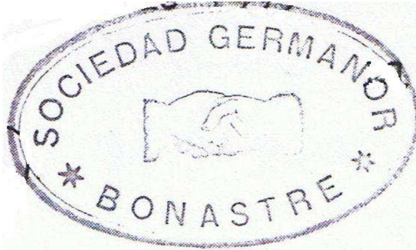
Segell de la Societat Germanor de Bonastre

És important remarcar el seu caràcter apolític així com també les seves fonts de finançament que eren les quotes dels socis.