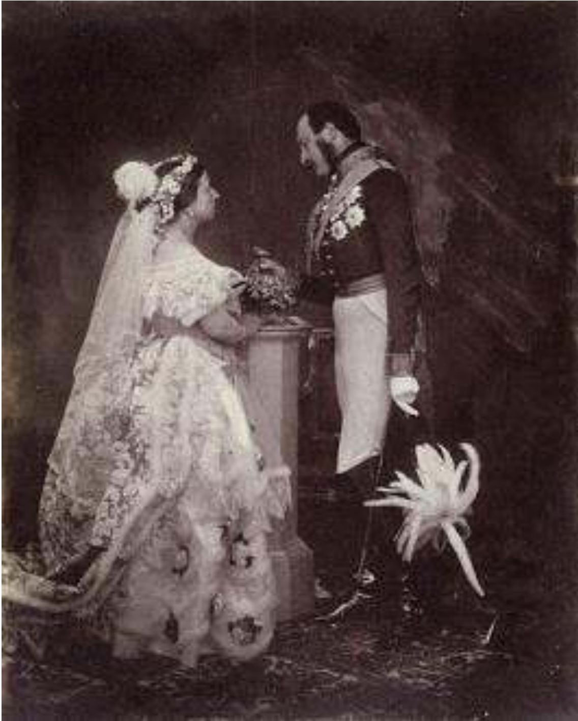
Reina Victòria i príncep Albert. 1854.